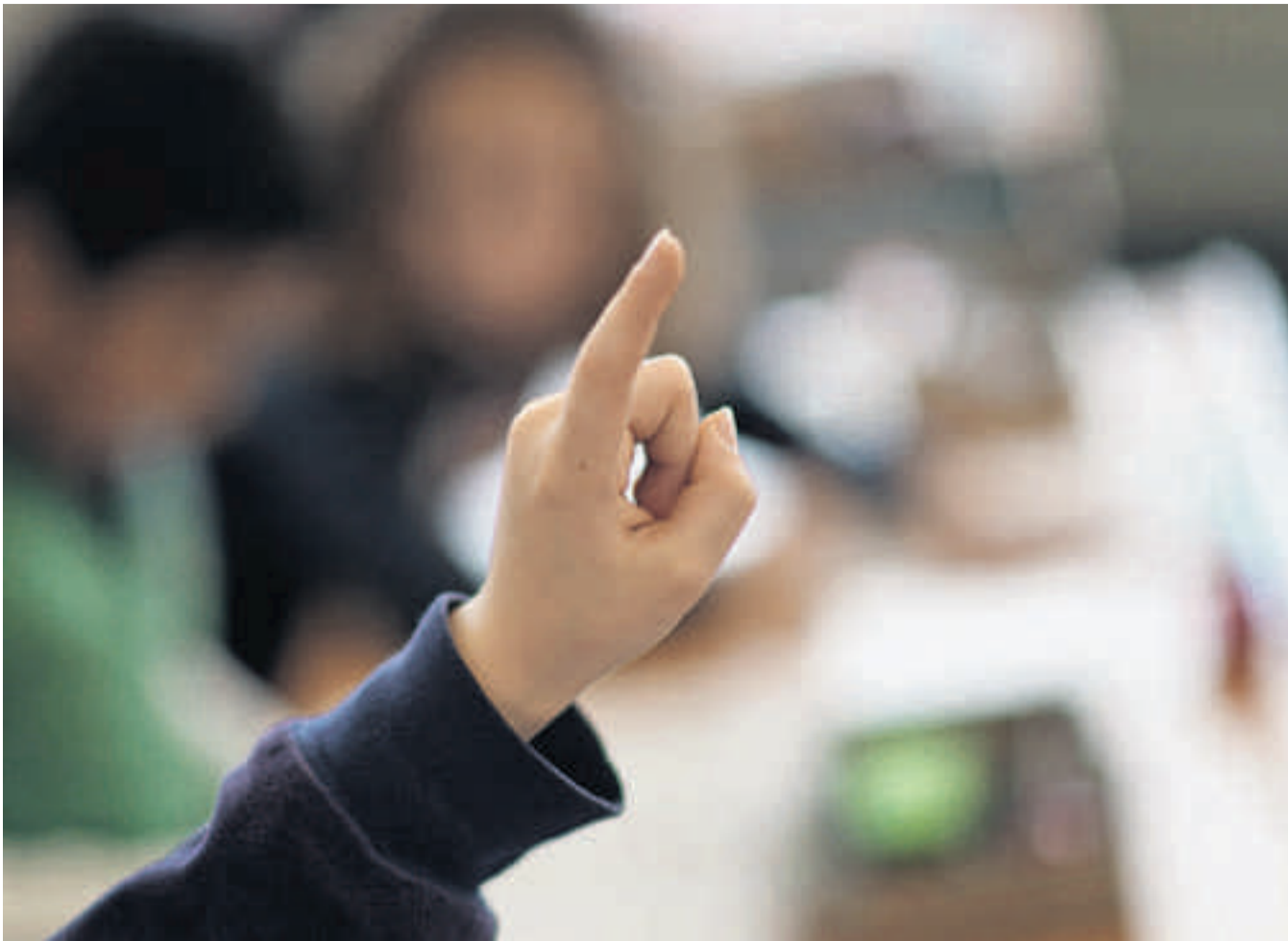
Sie weiss die Antwort. Einsatz im Unterstufenunterricht.