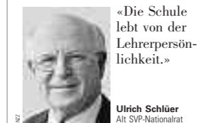
«Die Schule lebt von der Lehrerpersönlichkeit.»

Schliuer: Das ist schön zu hören, aber überzeugt bin ich nicht. Wie schnell sind die Bildungsverantwortlichen der öden Punkte-Jägerei des Bologna-Systems erlegen! Mir gefällt der Begriff Bildungsstandards grundsätzlich nicht. «Ziele» ist zutreffender. Ich bezweifle, ob bei definierten Standards die Methoden und die Lehrmittel tatsächlich frei bleiben. Wir sollten ohnehin weniger auf ausländische Schulmodelle schauen, sondern unser eigenes weiterentwickeln. Ein Systemfehler, der dringend behoben werden muss, ist das Konzept des Einheitslehrers auf der Oberstufe.