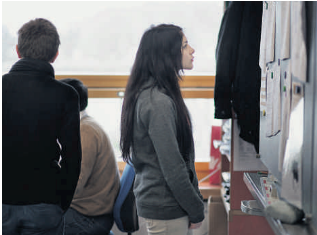
Das schwarze Brett im Blick. 3. Klasse Sekundarschule (Schulhaus Hellwies, Volketswil).

Mit Bewerbungen müssen sich die Sekundarschülerinnen an diesem Montag nicht auseinandersetzen. Ihre persönlichen Leistungen indes spielen trotzdem eine Rolle. Die Felder der erworbenen Kompetenzen werden nämlich mit einem leuchtend gelben Punkt markiert auf dem Raster. Einen solchen Punkt erhält, wer in einem Assessment