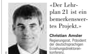
«Der Lehrplan 21 ist ein bemerkenswertes Projekt.»