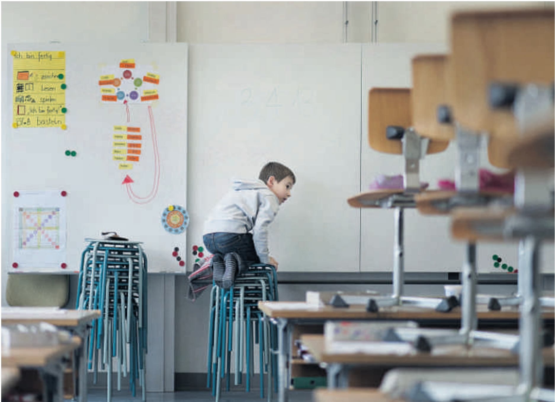
Die Schule ist aus.